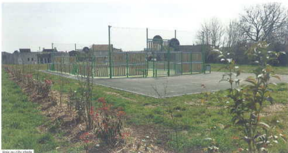
Voie au city stade

► Des travaux d'éclairage public vont être réalisés au Fassier sur la RD 137 : installation d'un réverbère pour un montant de 4 375 € HT, subventionné à 35 %.