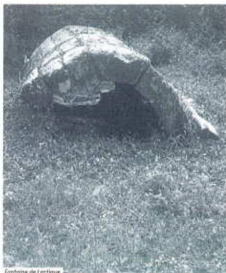
Fontaine de Lartigue

À l'église de Lafosse, avec l'agrément des Monuments Historiques, il est prévu la rénovation de l'autel du XIX e ainsi que le réaménagement du chœur.