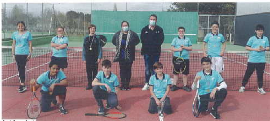
Tennis Pugnac Sport.

Le printemps est là en dépit de la lourdeur des mesures sanitaires, le Tennis Pugnac Sport met la jeunesse au cœur du jeu. En mars, plus d'une cinquantaine d'enfants (de 5 à 18 ans) se sont rencontrés dans plusieurs tournois sur les terrains extérieurs pour la compétition et le plaisir. Par ailleurs, faute de pouvoir s'entraîner en semaine après 18h, des créneaux ont été aménagés le week-end pour la section adulte en extérieur également, histoire de garder malgré tout l'Esprit Tennis.