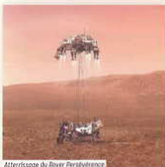
Atterrissage du Rover Persévérance