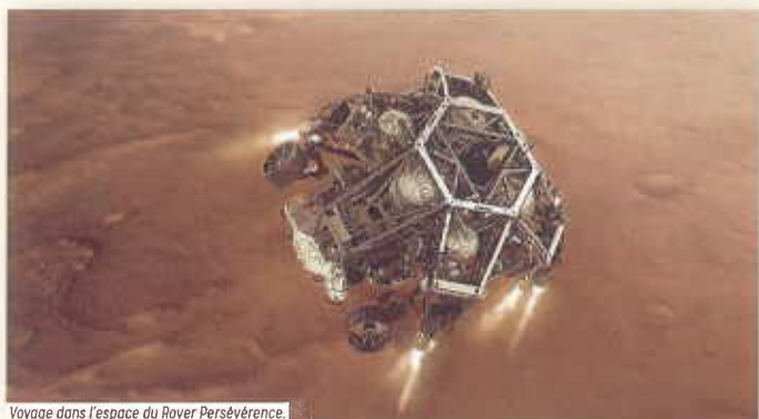
Voyage dans l'espace du Rover Persévérance.

Témoignage d'une présence d'eau sur la planète.