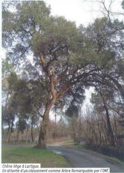
Chêne liège à Lortigue En attente d'un classement comme Arbre Remarquable par l'ONF.

Toute l'équipe municipale se joint à moi pour vous adresser nos sentiments dévoués.