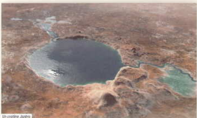
Un cratère Jezero